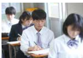
学校生活は朝学習から