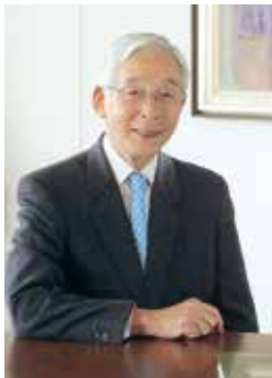
学校法人加藤学園 理事長 加藤学園暁秀中学校・高等学校長 東京大学経済学博士