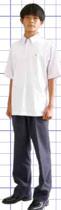
男子半袖 プルオーバーシャツ