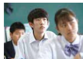
進学意識の高い生徒達