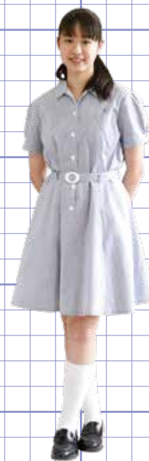
女子サマー ワンピース