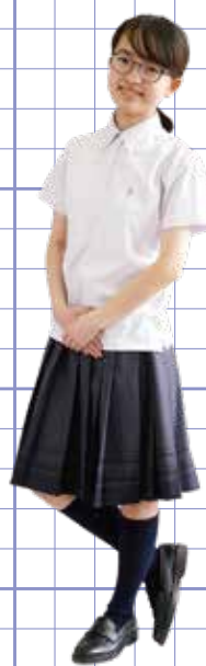
女子半袖 プルオーバーシャツ