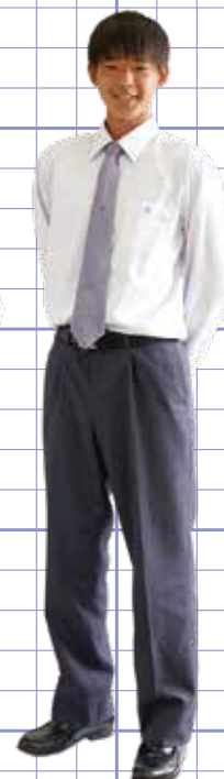
男子長袖 ワイシャツ