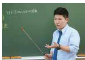
中身の濃い授業展開