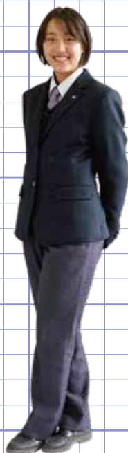
女子冬服 スラックス