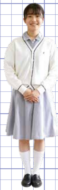
女子 カーディガン