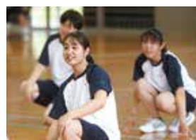
積極的な文武両道