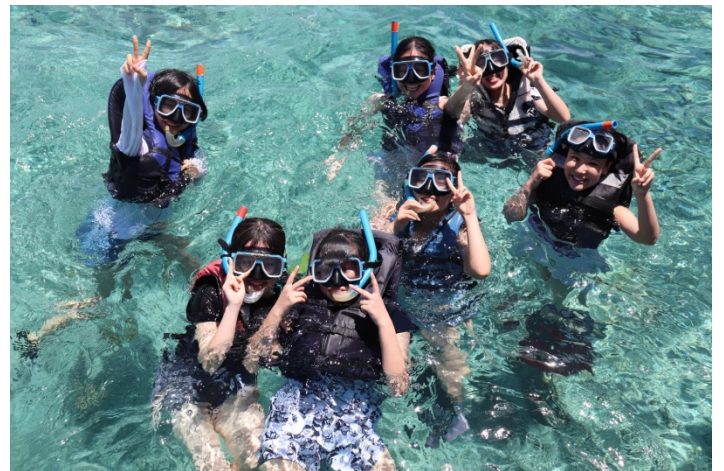
アイランドホッピングアクティビティー(シュノーケリング体験)