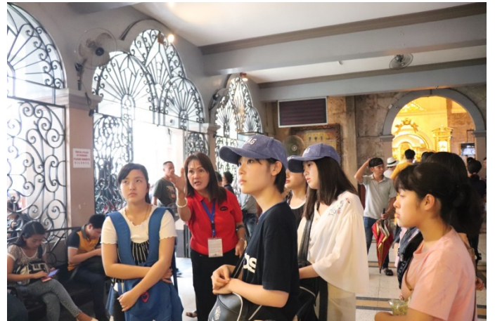
市内観光(サントニーニョ教会)