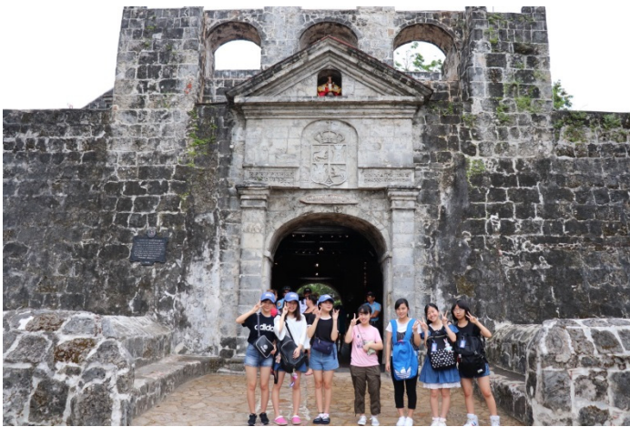
市内観光(サン・ペドロ要塞)