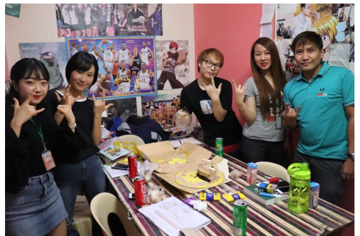
授業風景(グループ)