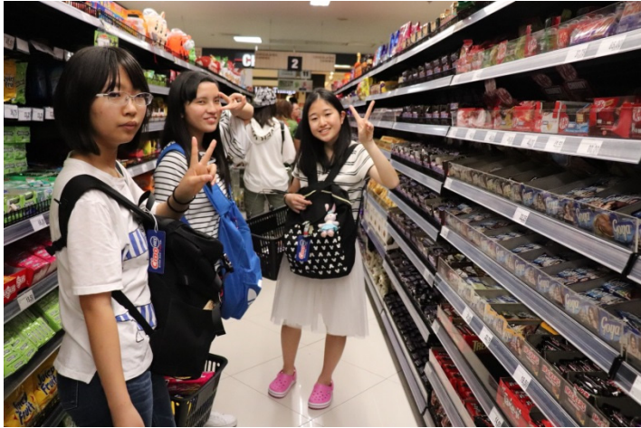
ショッピングツアー