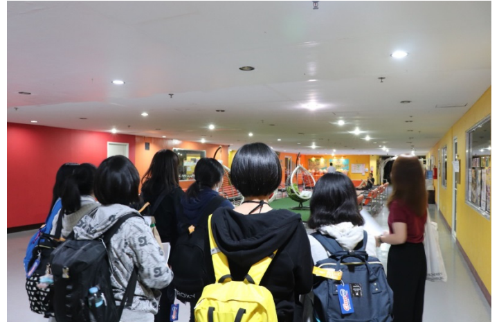
入学オリエンテーション