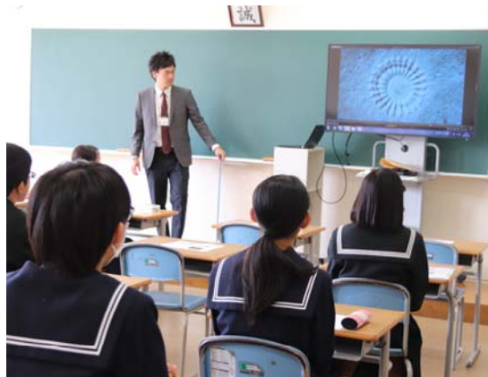
昨年度の授業体験の様子