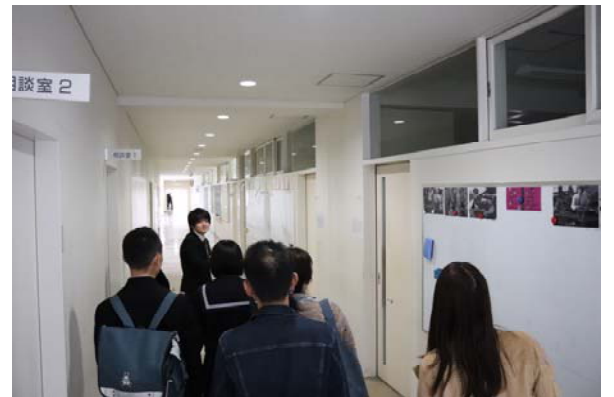
昨年度のキャンパスツアーの様子