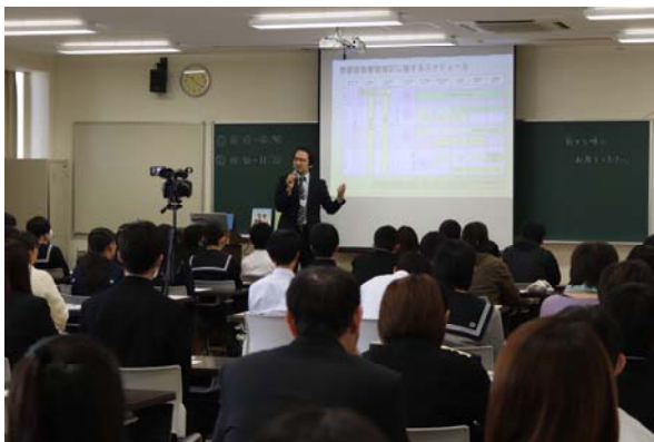
昨年度の入試対策講座の様子

④ ホームページでのお申し込み期間 9月7日(月)9:00~10月26日(月)12:00